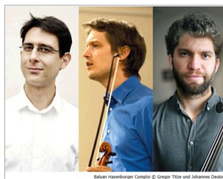
Balkan Hasenburger Complot

am Samstag, 15.08.2026, 11 Uhr in der Gießenbachmühle